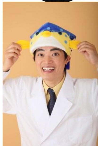
さかなクン 国立大学法人東京海洋大学 名誉博士・客員准教授